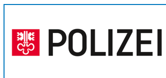
Police cantonale de Nidwald 35 AEDs