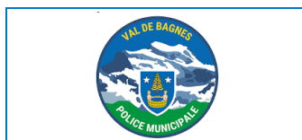
Police municipale de Val de Bagnes 2 AEDs