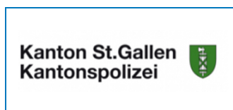
Police cantonale de Saint-Gall 22 AEDs