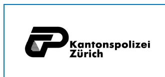
Police cantonale de Zurich 310 AEDs