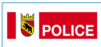
Police cantonale de Berne 125 AEDs