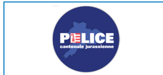
Police cantonale Jurassienne 28 AEDs