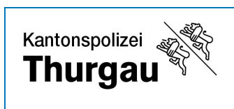
Police cantonale de Thurgovie 60 AEDs